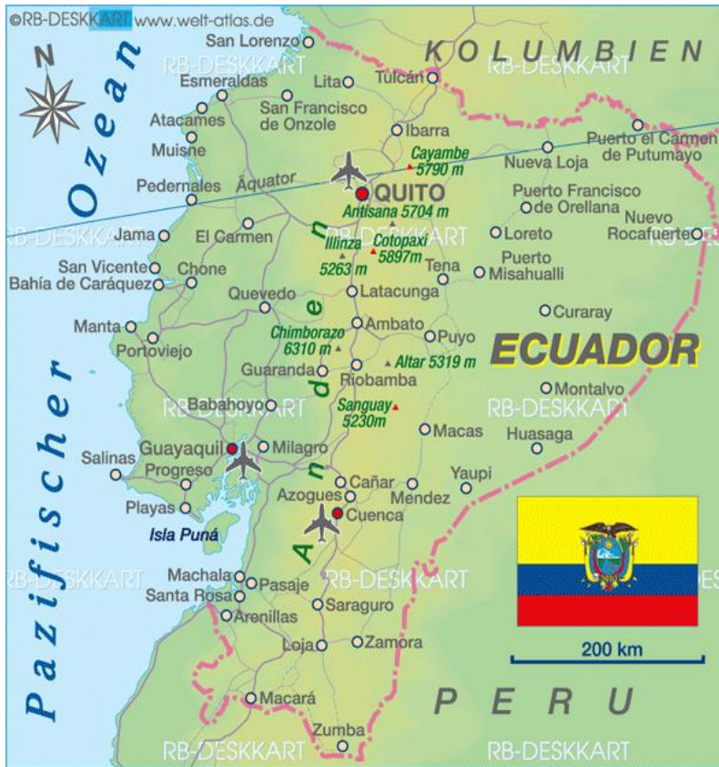
Karte 1: Übersichtskarte Ecuador